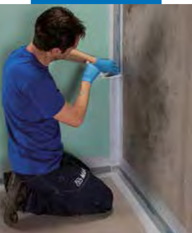
Aplicarea benzii Mapeband PE 120 folosind Mapegum WPS