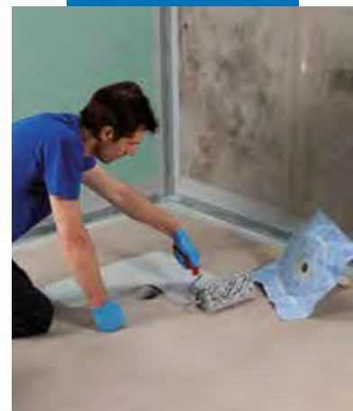
Aplicarea piesei de scurgere Drain Vertical utilizând Mapegum WPS