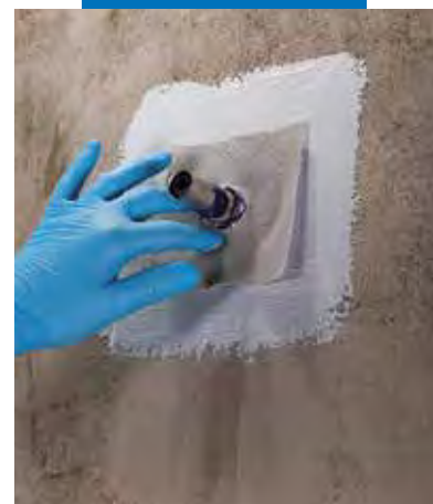
Aplicarea piesei speciale Mapeband PE 120 pentru țevi utilizând Mapegum WPS

NB: consumurile indicate sunt pentru o peliculă continuă aplicată pe o suprafață plană și vor fi mai mari pe suprafețe neuniforme.