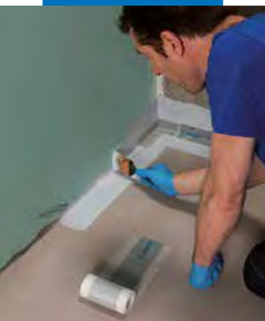
Aplicarea benzii Mapeband PE 120 folosind Mapegum WPS