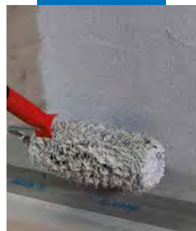
Aplicarea Mapegum WPS cu un trafalet